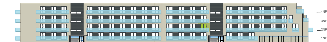
Severní pohled na dům / Building View - north side